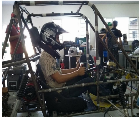
Figura 4: Adaptação do banco

Como pode ser observado na figura 4, a espuma do banco foi adaptada de forma que assegurasse o atendimento às legislações da competição, garantindo um espaço mínimo confortável e seguro ao piloto, ao mesmo tempo atendendo às distâncias necessários em relação aos demais controles dentro da gaiola.