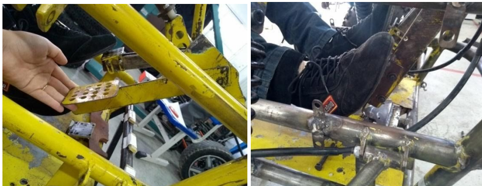
Figura 5: Antes e depois da adaptação do pedal de aceleração

Devido à necessidade de adaptação da base do pedal, foi desenvolvido um sistema de flexibilização com parafusos e o curso do pedal foi adequado, a fim de garantir um melhor apoio e fixação dos pés durante a pilotagem.