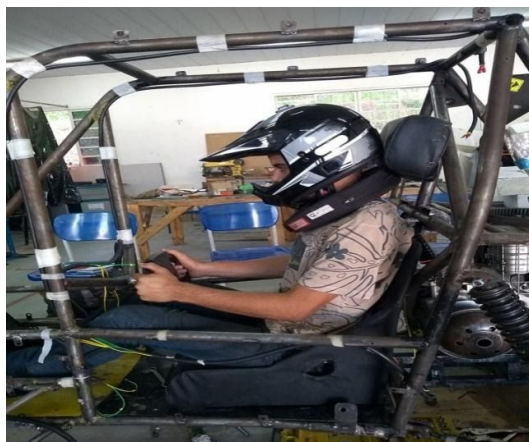
Figura 3: Adaptação do volante

Na figura 3 é possível observar que a altura do volante foi demarcada de maneira que atendesse os requisitos do piloto e de segurança do carro, possibilitando uma boa “pega” e pilotagem, ainda garantindo uma boa visibilidade para o piloto.