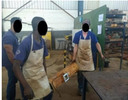
Figura 1 – Carregamento manual de motores em dupla

aumento em sua qualidade, já que o tempo gasto com a operação da ponte móvel foi economizado e o risco de dano ao sistema elétrico diminuído (Figura 1).