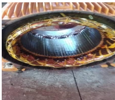
Figura 3: Parte elétrica do motor envolvida pela carcaça

Acontece que a carcaça abriga em seu interior a parte mais sensível do motor: o sistema elétrico, composto por uma série de ligações de fios de cobre, que podem ser facilmente rompidos. Uma vez rompido um único fio, toda a parte elétrica (Figura 3) deve ser refeita, gerando retrabalho e conseqüentemente perda de recursos.