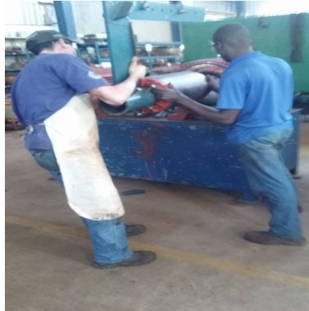
Figura 4 – Auxílio manual dos mecânicos ao encaixe do motor

No momento em que o eixo será colocado na abertura da carcaça, qualquer trepidação da ponte faz com que o eixo se balance e se choque contra a fiação elétrica, podendo romper um dos fios que a compõe e danificando-a por completo. Por se tratar de um dano sério, o momento de unir eixo-carcaça gera tensão entre os trabalhadores, fazendo com que dois mecânicos direcionem, manualmente, o eixo para a posição correta em direção à carcaça.