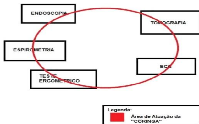
Figura 3: modelo de abrangência da função da auxiliar ‘coringa’.

Também elaborou-se uma reestruturação de funções, remanejando uma auxiliar para uma função ‘coringa’. A função prescrita dessa seria ter conhecimento de todas as atividades dos setores. Ou seja, ela será encarregada a ajudar onde solicitada. Segue o modelo de abrangência da função da auxiliar ‘coringa’: