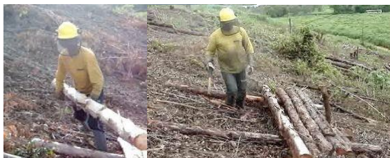
Figura 1: b) Empilhamento Manual