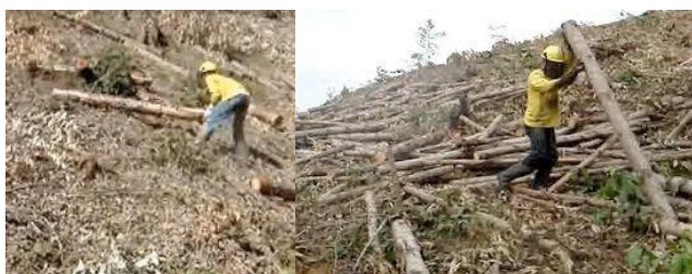
Figura 1: a) Tombo Manual

Os trabalhadores são divididos em equipes, cada uma delas com um supervisor responsável. A remuneração é feita por meio de salário fixo somado à uma remuneração variável, que está associada à produção individual. Observou-se que a meta de produção estabelecida não era cumprida pela maioria dos trabalhadores do Tombo e Empilhamento, o que ficou comprovado através da análise dos dados de produção ao longo de um ano, indicando que tal meta encontrava-se superestimada. A atividade de tomar e empilhar manualmente a madeira exigia grande esforço físico por parte do trabalhador, especialmente do tronco e membros superiores, ao manipular e movimentar as toras de madeira (tamanho 2,60m e peso variável entre 25 e 100kg cada). A atividade consistia no arremesso dos toretes de madeira “morro abaixo” até a margem das estradas, onde serão empilhadas posteriormente em uma plataforma feita com madeiras do local, chamada “travesseiro”. Para a movimentação das toras o trabalhador utiliza as próprias mãos ou um machado, comumente chamado “machadinha” (Figura 1).