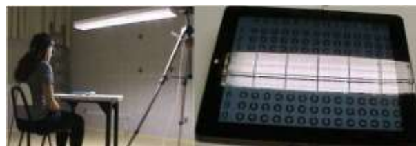
Figura 1 – Condición experimental con el partícipe en postura inicial Es su perspectiva visual desde el interfaz en estot tiempo.

destello horizontal acerca de uno área pre-determinado desde el interfaz (líneas 4, 5, 6 Es 7), como se muestra en la Figura 1. Una marcarastreado en el piso en paralelo hacia participe Es El 40 centímetros del lado bien desde el silla él era usado como referencia para el movimiento hacia adelante Es para atrás, en modo El directo oh ofuscación sobre líneas de caracteres predeterminado interfaz.