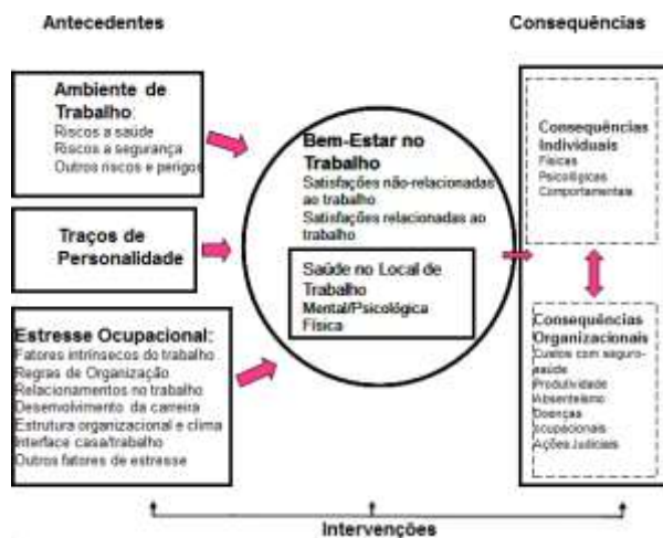
Figura 1. Esquema de Saúde e Bem-Estar no Local de Trabalho.

A importância de se estudar o homem em seu ambiente de trabalho é entendida por Guerin et al. (2001), na relação do operador com seus meios de trabalho. De um lado, um objetivo centrado nas organizações e no seu desempenho, que pode ser apreendido sob diferentes aspectos: eficiência, produtividade, confiabilidade, qualidade, durabilidade, etc. De outro, um objetivo centrado nas pessoas, este também se