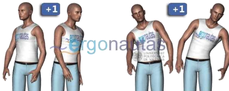
Figura 2 – Modificação da posição do Tronco