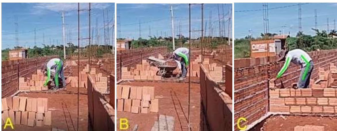
Figura 3 – Execução da elevação da alvenaria (fiadas iniciais)

A Figura 3 é uma representação do processo de levantamento de paredes, na qual a avaliação é feita somente da parte inferior com altura aproximada de 1,20m da alvenaria. No método RULA são atribuídas pontuações de 1 a 4, mas que diferentemente do outro método, são analisados juntamente com os escores. Os escores são análises realizadas a partir de cada membro que está