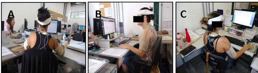
Figura 2A: uso da parte côncava da mesa em “L”

2B e 2C: uso da parte reta da mesa, subdividido em 2B: apoio direito e 2C: apoio esquerdo