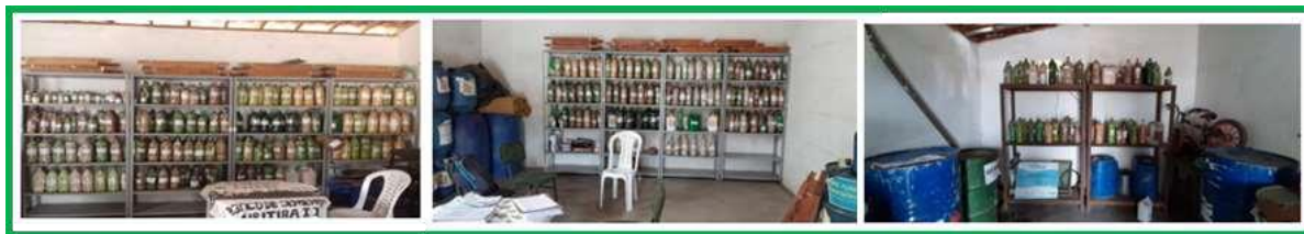
Figura 2: BSC de Queimadas-PB

Os BSC são geridos pelos próprios agricultores, dentre os quais um desempenha a função de um gestor, que integra a Comissão de Sementes da Rede de BSC do Território da Borborema-PB. As decisões são tomadas de forma coletiva em três diferentes níveis: BSC, município, Território. Assim, são realizadas reuniões periódicas junto aos associados do BSC, reuniões com os gestores dos BSC que integram a comissão dos BSC do município e, da Rede de BSC do Território, onde são discutidos os problemas, potencialidades e definidas estratégias de forma coletiva. Anualmente, é realizado o Encontro de Guardiães e Guardiões de Sementes do Território da Borborema, onde são apresentados os resultados dos trabalhos desenvolvidos em parceria com as instituições, palestras de formação, boas práticas realizadas em BSC e, são estabelecidas estratégias de ação. No evento acontece a feira de troca de sementes, incentivando o intercâmbio de sementes e conhecimentos.