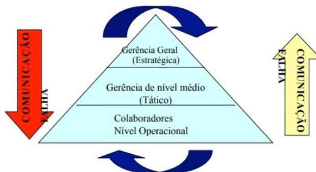
Figura 3: Contexto da comunicação na farmoquímica

parte da gerência aos colaboradores sobre as políticas da farmoquímica são restringidos ao desenvolvimento das tarefas prescritas pelos colaboradores, isto é o que foi evidenciado no setor de embalagens.