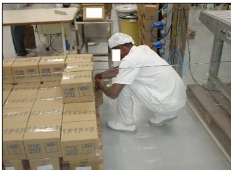
Figura 5: Momento de ocorrência de variabilidade humana no processo e regulação.

O que se pretendeu realizar foi uma amostragem, ou seja, um recorte do funcionamento da farmoquímica, no setor de embalagens, visando entender a atividade em si, e as formas da organização do trabalho homem-tarefa-máquina, na qual está inserida a visão da atividade como um todo e como ela se realizada pelo colaborador.