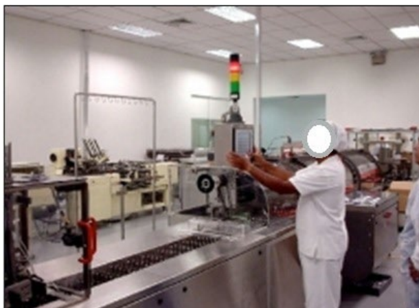
Figura 4: Momento de ocorrência de variabilidade incidental no processo e regulação.

Segundo Vidal, (2002) variabilidade admite duas gêneses distintas, quais sejam: a variabilidade normal e a incidental. Por variabilidade normal, este autor entende ser aquela que pode ser esperada, mesmo que sejam observados todos os preceitos, normas e balizamentos da execução da tarefa, como exemplos: as variações sazonais no volume de produção de medicamentos antigripais e de alergias em período de inverno, o crescimento da demanda de produção de produtos de proteção solar, no período de verão etc. Estas variações, por mais que sejam esperadas, podem ser maiores ou menores, dependendo do contexto em que ocorrem, porém, irão atuar de forma considerável nas atividades da indústria farmoquímica. Já a variabilidade incidental conforme Figura 4 – possui sua gênese de ocorrência de forma não esperada, ou seja, surge de surpresa, como exemplo: uma ferramenta ou equipamento que quebra no meio do pico de produção, paralisando a atividade por várias horas ou dias, um acidente de trabalho etc.