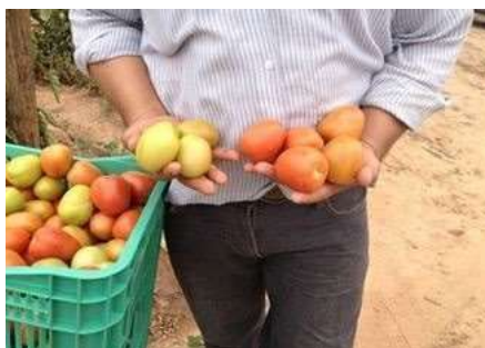
Figura 1. Frutas seleccionadas

En medio de un ambiente de variabilidad, los trabajadores desarrollan sus modos de operación de acuerdo con las representaciones mentales que tienen sobre lo que es una fruta sana y apta para la cosecha. Estos aspectos se formaron a través del aprendizaje de los compañeros de trabajo y a través de la práctica misma. Pueden mirar y tocar la fruta y, entre varias características, identificar cuál es o no adecuada y qué causó los defectos. La figura 1 muestra una cosechadora que muestra que, aunque los tomates tienen diferentes tonos (rojo, rosa, amarillo o naranja), todos están clasificados como aptos para la cosecha.