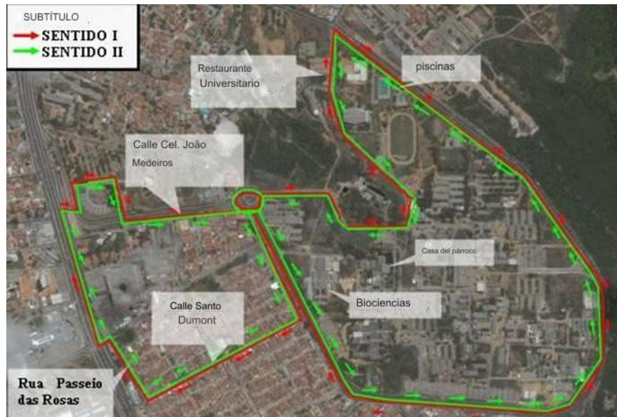
Figura 02: Mapa del Campus Universitario