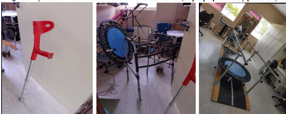
Figura 3. Ayudas a la movilidad utilizadas en la rehabilitación (etapas preprotésicas y protésicas)

En la investigación situada, durante el primer encuentro a distancia con la terapeuta ocupacional, ella presentó a través de diapositivas , los sectores de atención a los miembros del grupo, hablando sobre las prótesis y órtesis prescritas para niños, adultos y ancianos atendidos en el lugar. Posteriormente, en la primera acción conversacional, se encontró que el sector de amputados y malformes está formado mayoritariamente por adultos y ancianos, y se conocieron algunos ejemplos de ayudas a la movilidad utilizadas en el tratamiento de rehabilitación, como se muestra en la Figura 3: