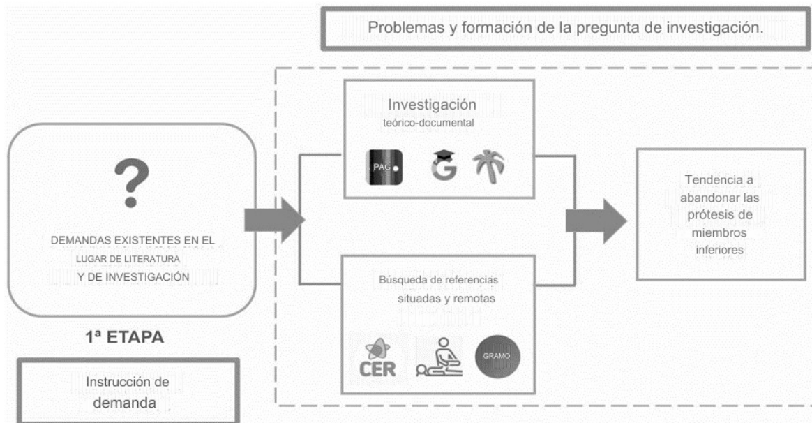
Figura 1. Esquema de instrucción de demanda