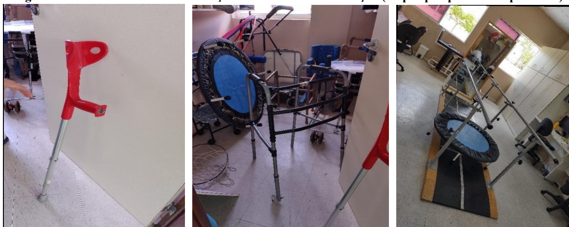
Figura 3. Meios auxiliares de locomoção utilizados na reabilitação (etapas pré-protética e protética)

Na pesquisa situada, durante a primeira reunião remota com a terapeuta ocupacional, esta apresentou via slides , os setores de atendimento aos integrantes do grupo, discorrendo sobre as próteses e órteses prescritas para as crianças, adultos e idosos atendidos no local. Posteriormente, na primeira ação conversacional apurou-se que o setor de amputados e mal formados é formado, majoritariamente, por adultos e idosos e ainda, conheceu-se alguns exemplos de meios auxiliares de locomoção utilizados no tratamento de reabilitação, como exibido na Figura 3: