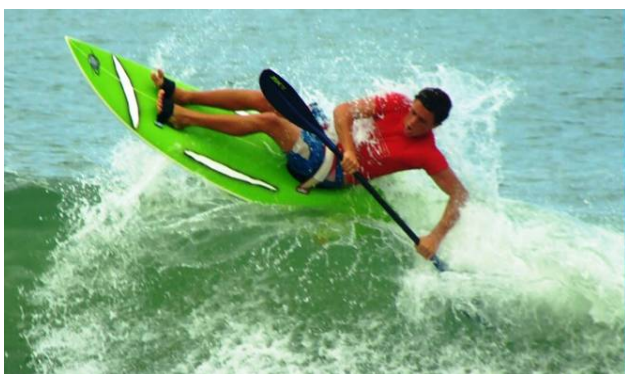
Figura 1 - Atleta praticando o Waveski

O waveski é um esporte dinâmico e radical, que alia o surfe à canoagem, onde o atleta surfa sentado em uma prancha, com auxílio de um remo de pá dupla, conforme representado na figura 1. A modalidade, juntamente com o Kayaksurf , são esportes de canoagem em onda, uma das modalidades da canoagem, conforme a Confederação Brasileira de Canoagem - CBCA (2008). Embora pareça um esporte novo, pode ter suas origens muito antes que o próprio surfe, pois os incas utilizavam embarcações feitas de junco, denominadas “cavalo de totora”, e um pedaço de bambu como remo, para a prática da pesca, viagens exploratórias e surf sentado como entretenimento.