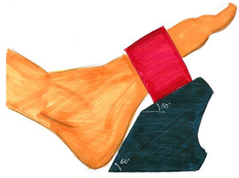
Figura 4- Vista lateral da pedaleira

O cinto, o assento e a pedaleira possuem regulagens de profundidade, que além de tornar a prancha adaptável a diversos percentis, auxilia no equilíbrio do centro de gravidade do conjunto atleta-prancha. O formato da pedaleira prevê a fixação dos pés por duas áreas de contato, o calcanhar e o peito, com um vão livre, conforme ilustrado na figura 4. Ao mesmo tempo que fixa os pés do usuário durante o uso, em caso da prancha virar o saque é rápido.