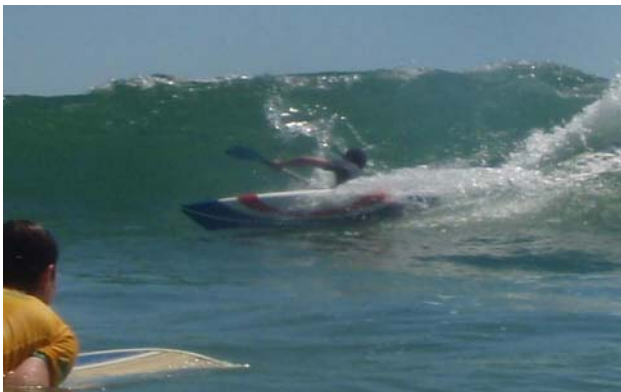
Figura 6- Atleta realizando manobras com o protótipo.

A largura da prancha demonstrou-se adequada. Aliada ao baixo centro de gravidade do conjunto, devido à baixa posição do assento e pedaleira, a prancha foi considerada de fácil equilíbrio, tanto pelos atletas experientes quanto pelos usuários inexperientes no esporte. Uma maior largura poderia tornar a prancha ainda mais estável, mas dificultaria a sua projeção na onda. Apesar das grandes dimensões da prancha (244 cm de comprimento e 62 cm de largura) em relação a modelos voltados a atletas experientes, os atletas que a testaram consideraram-na com boa manobrabilidade para seu tamanho, como pode-se observar na figura 6, o que facilita a iniciação de manobras por parte dos iniciantes.