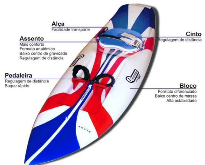
Figura 5- Protótipo finalizado

Após o desenvolvimento das etapas projetuais foi efetuada a construção do protótipo, em parceria com a empresa Bless Allboards , de Florianópolis. O protótipo funcional foi elaborado em bloco de poliestireno expandido (EPS) e laminação com resina epóxi e fibra de vidro. O resultado final pode ser conferido na figura 5.