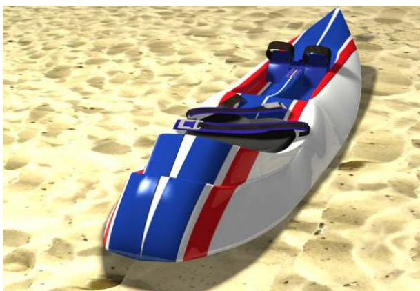
Figuras 3 – Render virtual

O conceito elaborado atendeu aos requisitos do briefing: seu formato de deck é exclusivo e difere bastante dos encontrados no mercado; Seu formato de fundo, rabeta e largura privilegiam a estabilidade; o assento possui baixo centro de gravidade, auxiliando no equilíbrio. O render virtual pode ser conferido na figura 3.